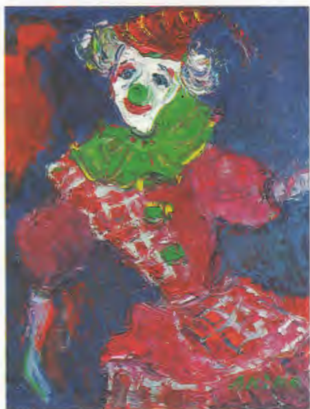
ピエロ 油彩 谷 晶子