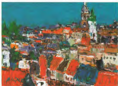
プラハにて 油彩 谷 晶子