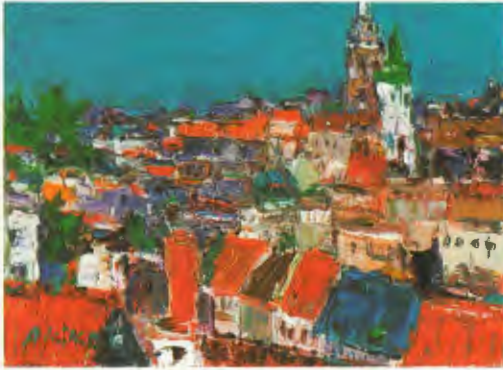
プラハにて 油彩 谷 晶子